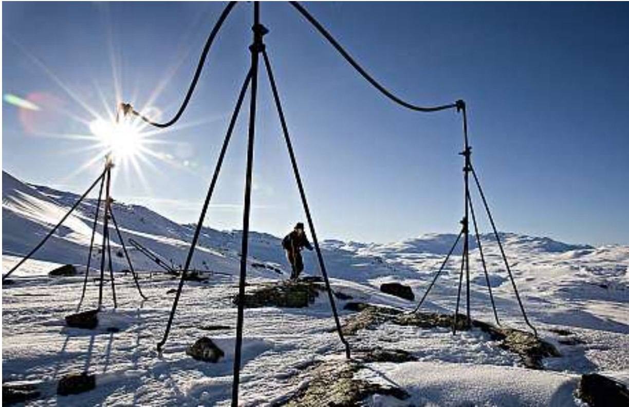
KUNST: Rester etter eldre tiders kraftutvinning er eneste tegn til sivilisasjon. Kunst, mener hulemannen.