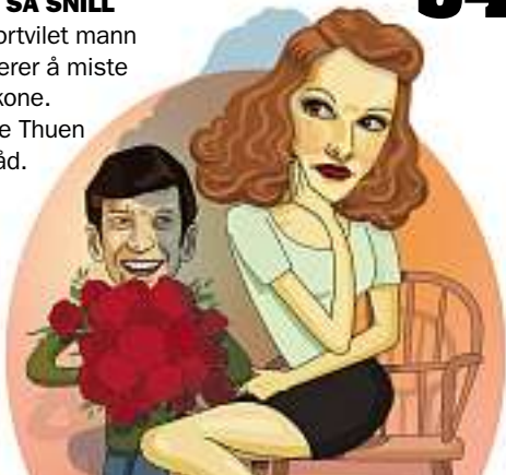
ILL.: TORA M. NORDBERG/SVOVEL.NOI