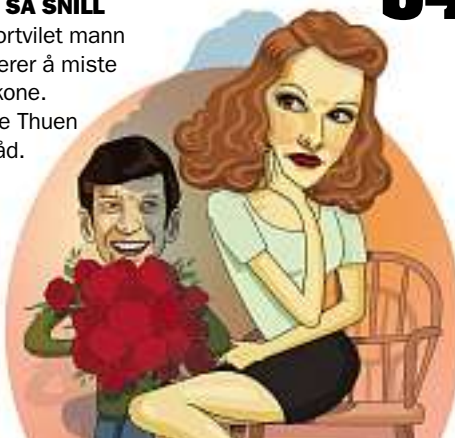
ILL.: TORA M. NORDBERG/SVOVEL.NOI